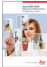
Leica GS09 GNSS

スイス・ヘルブルグ(Heerbrugg)のライカ ジオシステムズ社(Leica Geosystems AG)は、ISO(International Organization for Standardization=国際標準化機構)の品質管理および品質保証のための規格(ISO 9001および ISO 14001)に適合しているとの認証を受けています。 総合品質管理。それが、すべてのお客様に満足していただくための私たちの公約です。